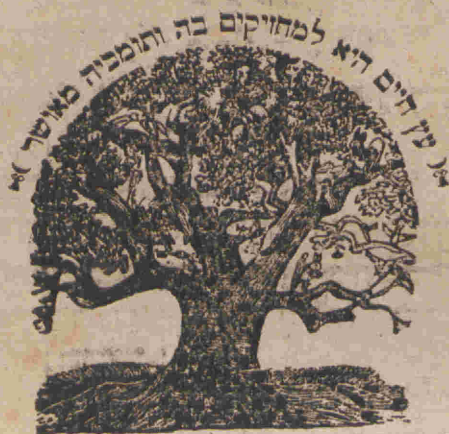
והרבתי את פרי העץ (יתקבל לעי)

כי יברכך ה' אלהיך. ונתת בכסף וצרת הכסף בדרך. והלכת אל המקום אשר יבחר ה' אלהיך בו ונתת הכסף בכל אשר תאוו נפשך. כי יברכך ה' אלהיך. ונתת בכסף וצרת הכסף בדרך. והלכת אל המקום אשר יבחר ה' אלהיך בו. כי יברכך ה' אלהיך. ונתת בכסף וצרת הכסף בדרך. והלכת אל המקום אשר יבחר ה' אלהיך בו.